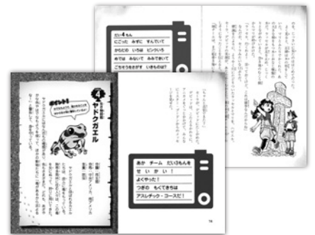
すべての漢字によみがなつき。全160ページ。

アマゾンの熱帯雨林で、まぼろしの生き物をさがして冒険するレースが開催されることになった。チーム4人で力をあわせ、なぞをといてゴールをめぎせ!