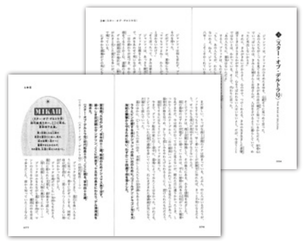
小学3年生以上の漢字によみがなつき。全240ページ。

デルトラ国にすむ少女ブリッタは、亡き父のあとをついで船乗りになるため、冒険の旅に出る! —世界的ベストセラー「デルトラ・クエスト」シリーズ最新作!